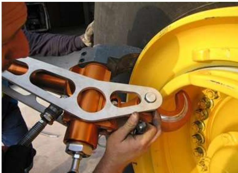
Anvendelse på EM forside