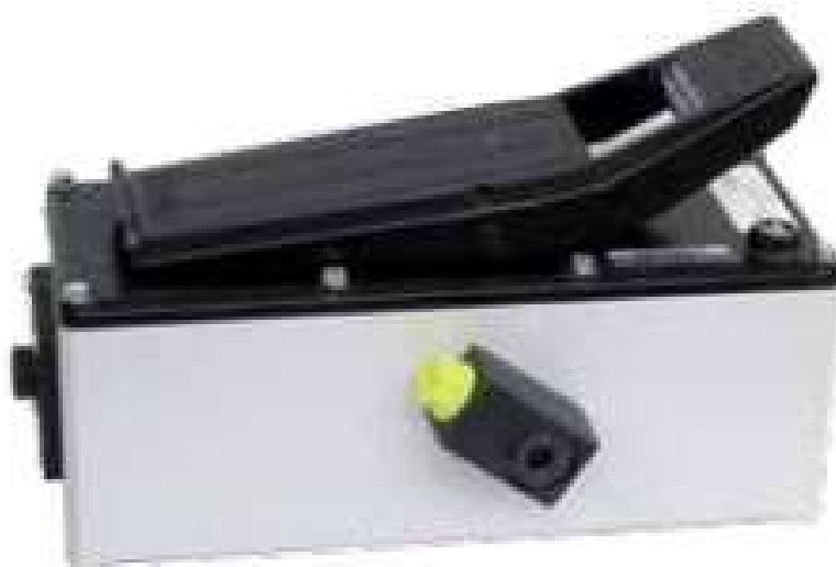
Luft-Hydraulisk pumpe 519 1520