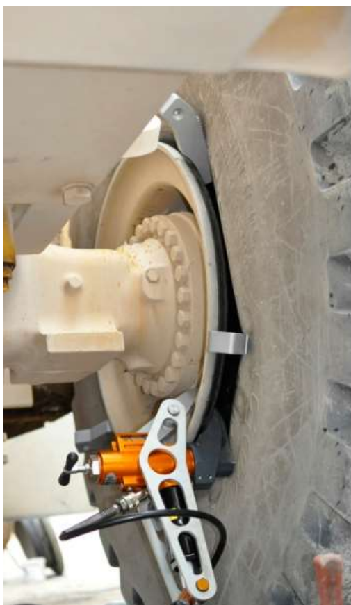
Anvendelse på EM bagside