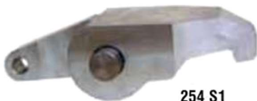
Specialnæb 519 1599